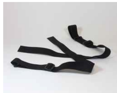
Suspensores cosidos para soporte de espalda