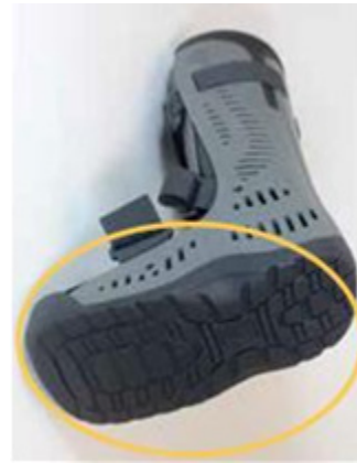
Rebound® Air Walker