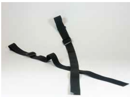
Suspensores con clip para soporte de espalda