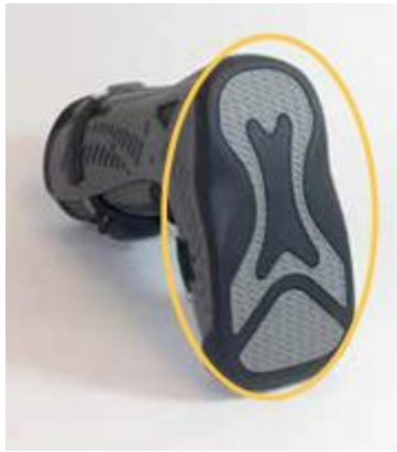
Rebound® Diabetic Walker