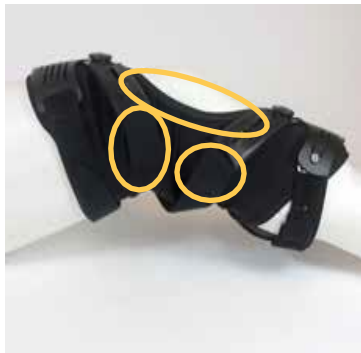
Rodillera Rebound® Cartilage