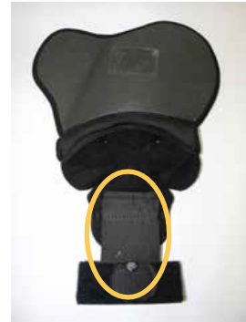
Protector de la rótula