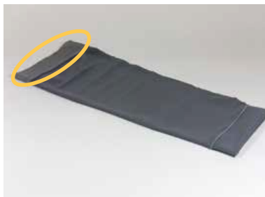
Funda (manguito) para rodillera gris

En el Anexo 1 se indican los números de los modelos de los productos de la línea ortésica de Össur afectados.