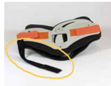
Collarín Necloc® (números de lote anteriores a MX151001)