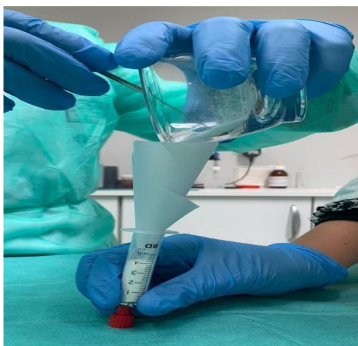
Figura 1. Volumen que ocupan 10 comprimidos de Beloken® 100 mg