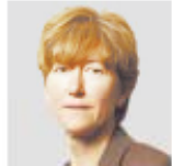
Sarah Boseley The Guardian, Thursday 12 August 2010

Antibiotics are a bedrock of modern medicine. But in the very future, we're going to have to learn to live without them once again. And it's going to get nasty